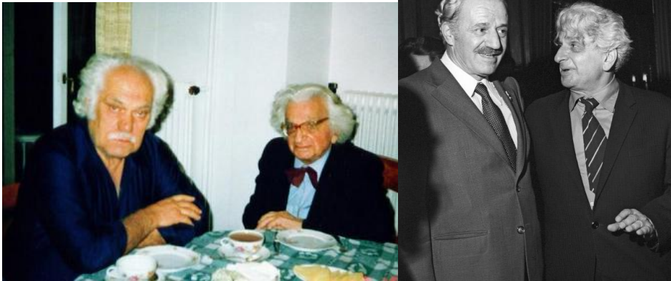
τιταν науки, архεολογ Виктор Сариянниди / ο τιτάνας της επιστήμης Βίκτωρας Σαργιαννίδης