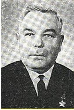
Степан Мурза – Στέφανος Μουρζάς