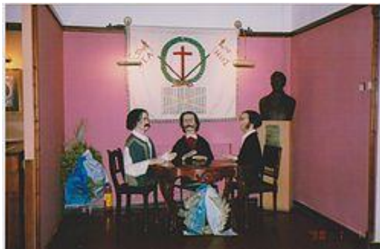
Αναπαράσταση των Φιλικών, που συζητούν την ίδρυση της Φιλικής Εταιρείας στην Οδησό το 1814

ΑΘΑΝΑΣΙΟΣ ΤΣΑΚΑΛΩΦ (1788-1851), εκ των εγκρίτων Ηπειρωτών, κύριος ιδρυτής της Φιλικής Εταιρείας, υιός του εν Μόσχα εμπόρου Ιωάννου Τσοκάλογλου, μεταβαλόντος το όνομά του εις Τσακάλωφ , εγεννήθη εις τα Ιωάννινα.