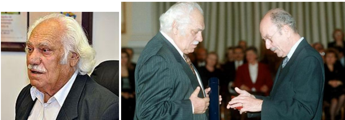
и естественно и наши современники, αλλά και οι σύγχρονοι, οι δικοί μας άνθρωποι,